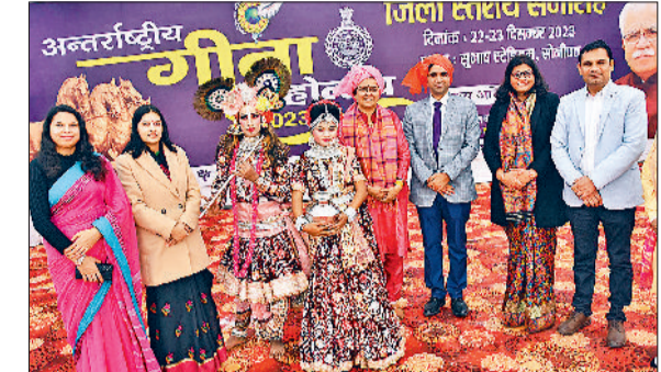
सोनीपत। कार्यक्रम के दौरान प्रतिभागियों के साथ अतिथिगण।