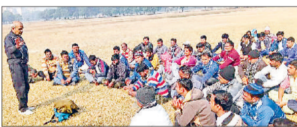
सोनीपत। मांगों को लेकर बैठक करते कर्मचारी।