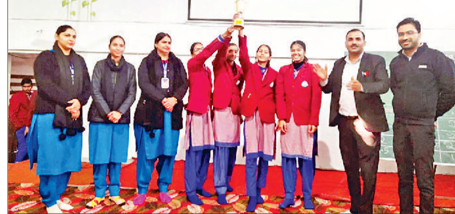
गोहाणा। प्रसन्नचित मुद्रा में विजेता विद्यार्थी अपने शिक्षकों के साथ।

प्राचार्य ने विद्यार्थियों को गणित के प्रति रुचि बनाने के लिए प्रोत्साहित किया