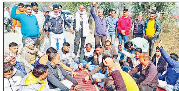
गन्नीर। गिरफ्तारी की मांग को लेकर धरना देते बिजली कर्मचारी।